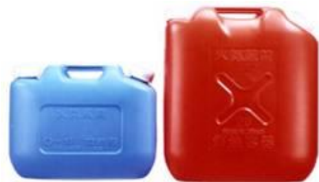
ガソリンの貯蔵に適さない容器の例 (樹脂製容器は火災危険性が高い)